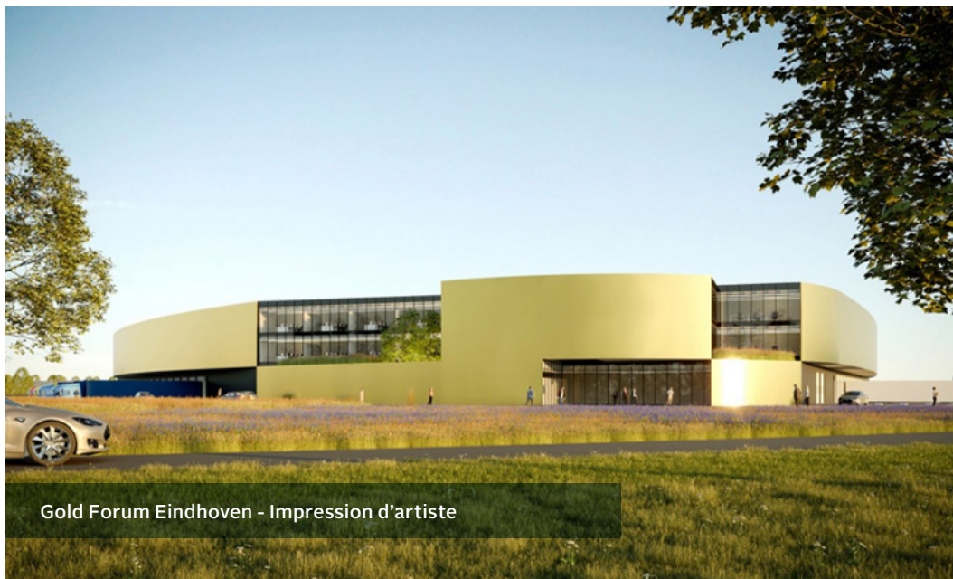
Gold Forum Eindhoven - Impression d'artiste

Avec le projet de développement Gold Forum, Interinvest étend sa position logistique à près de 50.000 m 2 aux alentours de l'aéroport d'Eindhoven