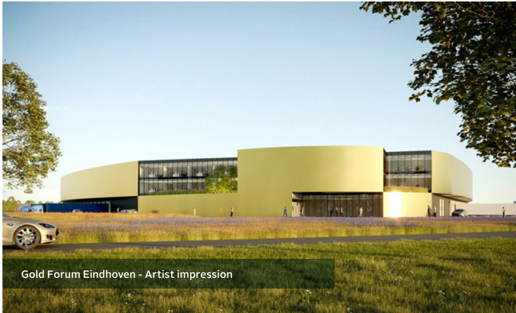
Gold Forum Eindhoven - Artist impression

Intervest breidt met projectontwikkeling Gold Forum haar logistieke positie nabij de luchthaven van Eindhoven uit tot bijna 50.000 m 2