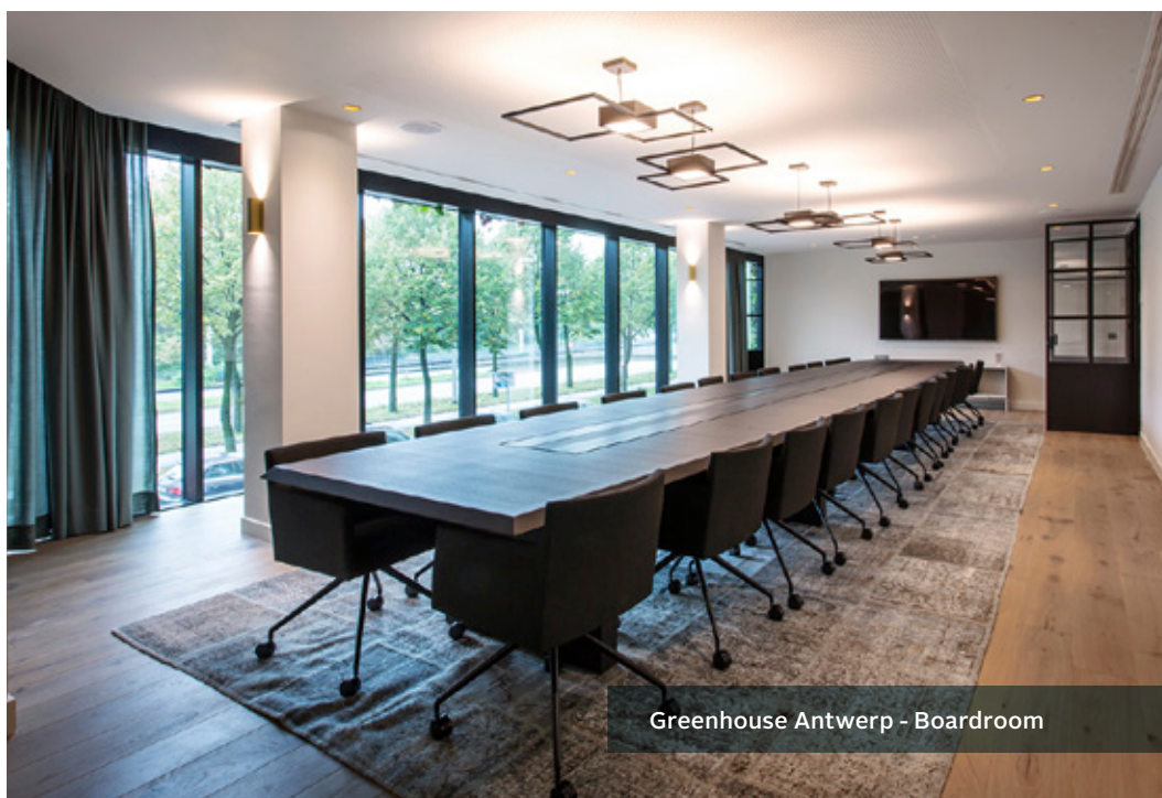
Greenhouse Antwerp - Boardroom

Au cas où le quorum nécessaire n'est pas atteint lors de l'assemblée générale extraordinaire une deuxième assemblée générale extraordinaire aura lieu le lundi 18 mai 2020 à 10h00 au siège d'Interinvest pour délibérer de l'ordre du jour et des propositions de résolution.